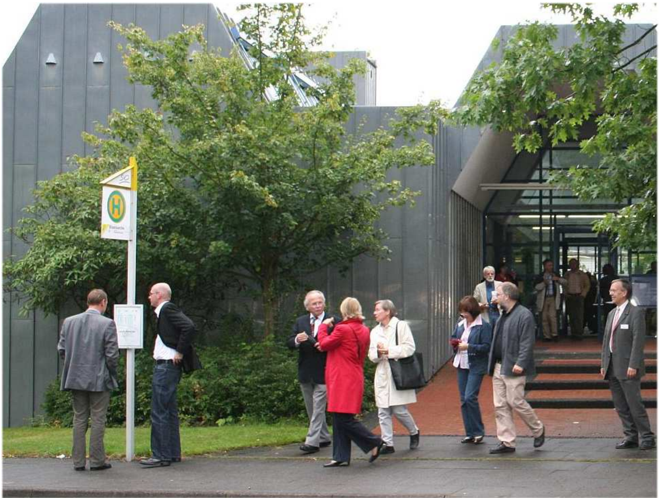
Staats- und Personenstandsarchiv Detmold